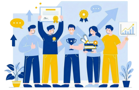
收穫滿滿學習成果