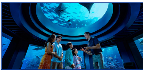
新加坡海洋館(新開幕)