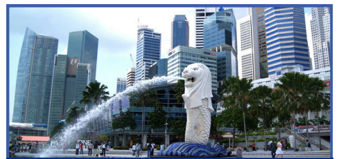
參訪新加坡科技中心+魚尾獅公園