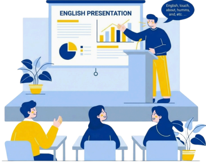
成果展示與英文表達