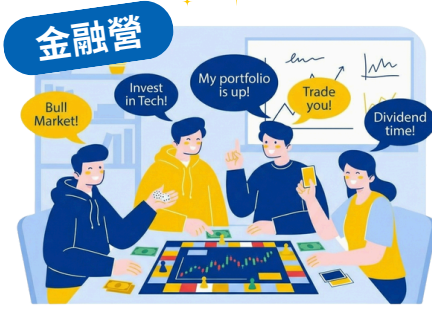
金融投資理財與商業思維