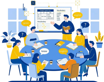
主題式(金融/STEAM) 情境英語