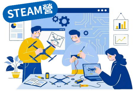
無人機 STEAM 實作探索