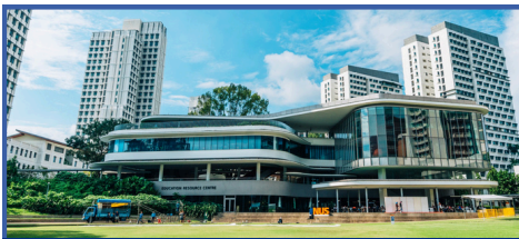
新加坡國立大學校園