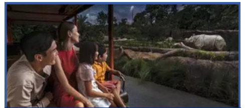
世界首座夜間野生動物園