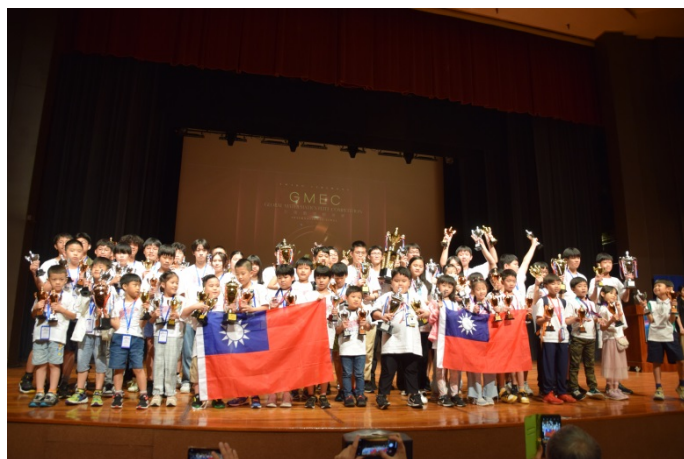
※2024 年 台灣代表隊