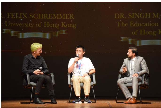
※2024 年 與教授的一席話

2. AoPS 遊學團獎金：全球冠軍將獲得參加 AoPS 遊學團的全額獎學金（僅包含課程）。