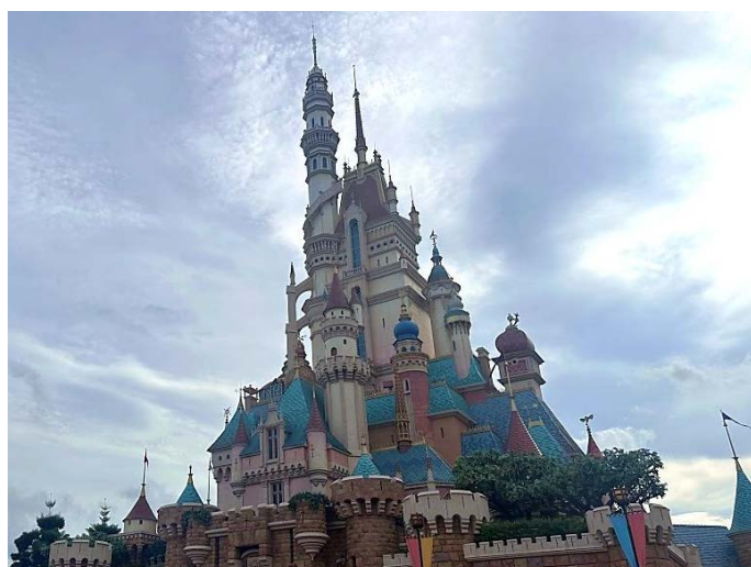
※2024 年 前進香港迪士尼