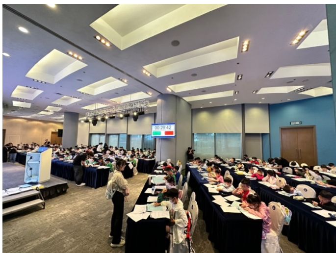
※2024 年 GMBC 總決賽現場